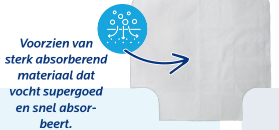
Bovenkant van Turnability

Het onderste deel (glijtunnel) wordt niet nat en de patiënt kan hierdoor moeiteloos worden verplaatst.