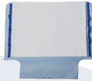
Onderkant van Turnability

Voorzien van sterk absorberend materiaal dat vocht supergoed en snel absorbeert.